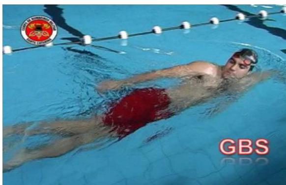
Fig 5 (Finalização da pernada tesoura)