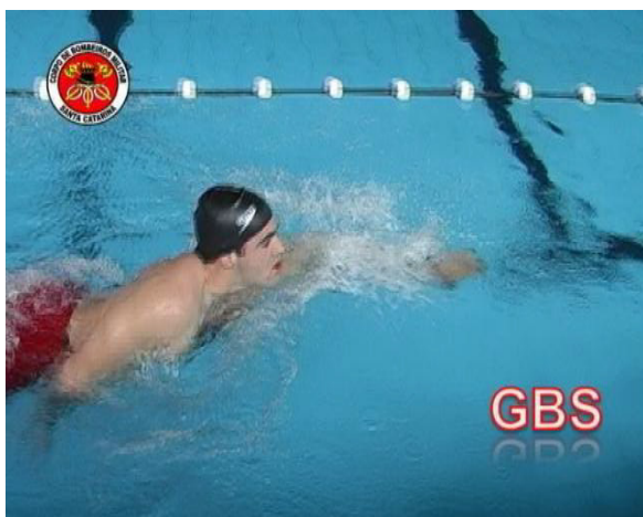
Fig. 1 (Nado crawl cabeça fora da água)